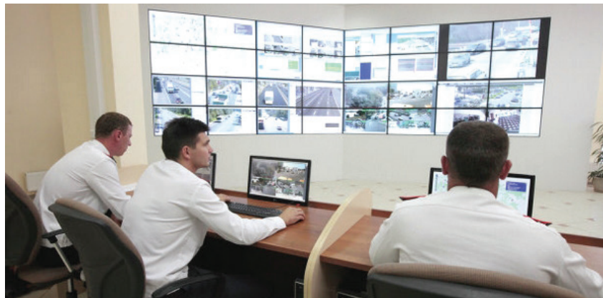
Мониторинг рабочего состояния СО в режиме on-line

«ДК 2» – современный дорожный контроллер с оптимальным набором функций и разумной ценой. Он содержит до